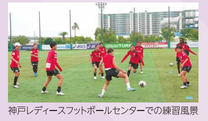
神戸レディーズフットボールセンターでの練習風景

新外国人選手5人が加わり、WEリーグ2024-25シーズンがスタートしました。“神戸から世界へ”をコンセプトに、応援してくれる全ての皆さんと共に3シーズンぶりのリーグ制覇を目指します。 Vamos! レオネッサ! ※Vamos=スペイン語で「さあ、行こう」の意味